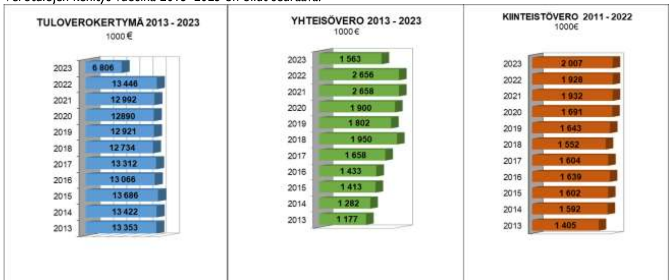
Kuva 4. Verotulojen kehitys vuosina 2011–2023

Verotulojen kehitys vuosina 2013–2023 on ollut seuraava: