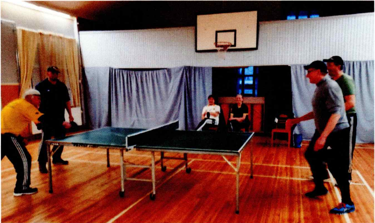
Visuveuden NS-talon juhlasalin ja salonki-kirjaston välinen aukko ja sitä nyt peittävä pressu. Siirrettävistä elementeistä koostuva väliseinä on tarkoitus asentaa kuvassa näkyvän parven alle.